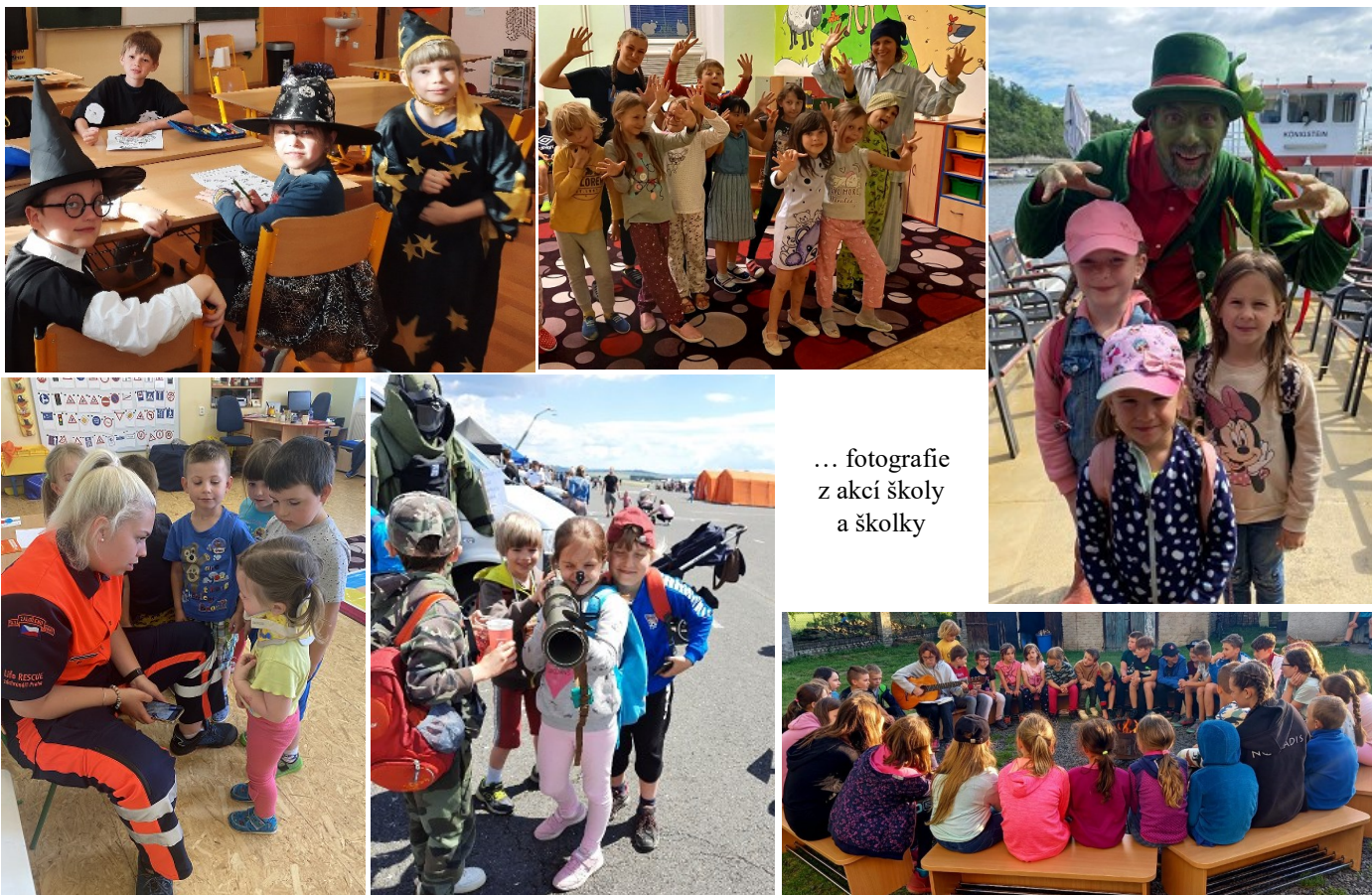
... fotografie z akcí školy a školky